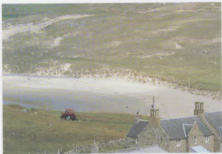
Bàgh Fharra, an Cataibh