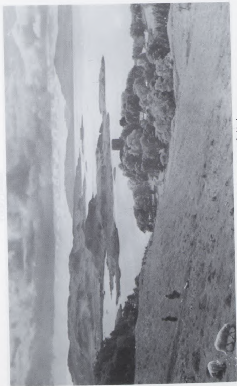
Caisteal Dhun Ollaidh agus Aird an t-Snáimh