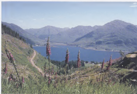
Loch Dubhthaich agus Beanntan Chinn t-Saile