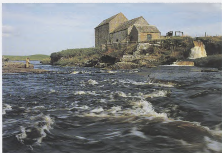
Abhainn Theòrsa, an Gallaibh