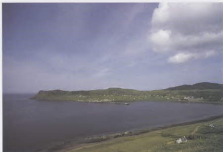
Bàgh Uige, an t-Eilean SgitheanachLoch