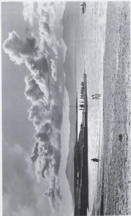
Gainneamhan, faisg air an Oban