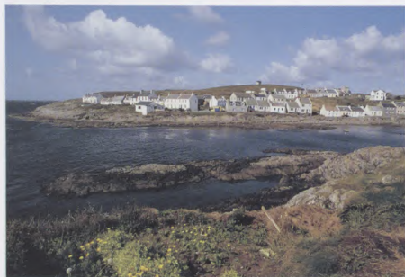
Port na h-Abhainne, Ile