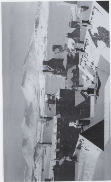
“Chi mi Muile nam beann fuar fada bhuam thar an t-sàil”