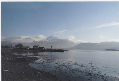
Beinn Nìmheis agus a' Chorpach