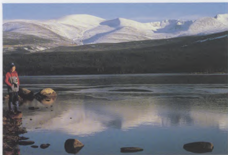
Loch Mhùrlaig agus am Monadh Ruadh