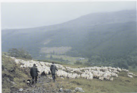
A' Toirt Chaorach às a' Bheinn (Loch Bhraoin)