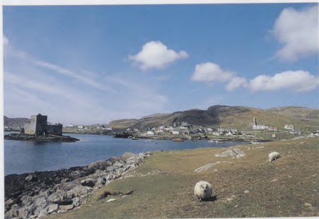
Bàgh a' Chaisteil