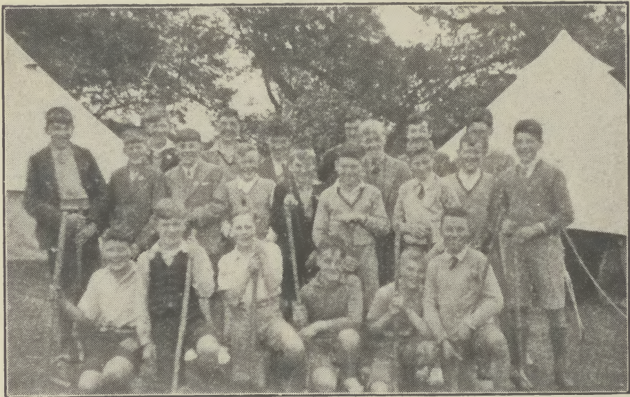
Na Balaich, 1937.