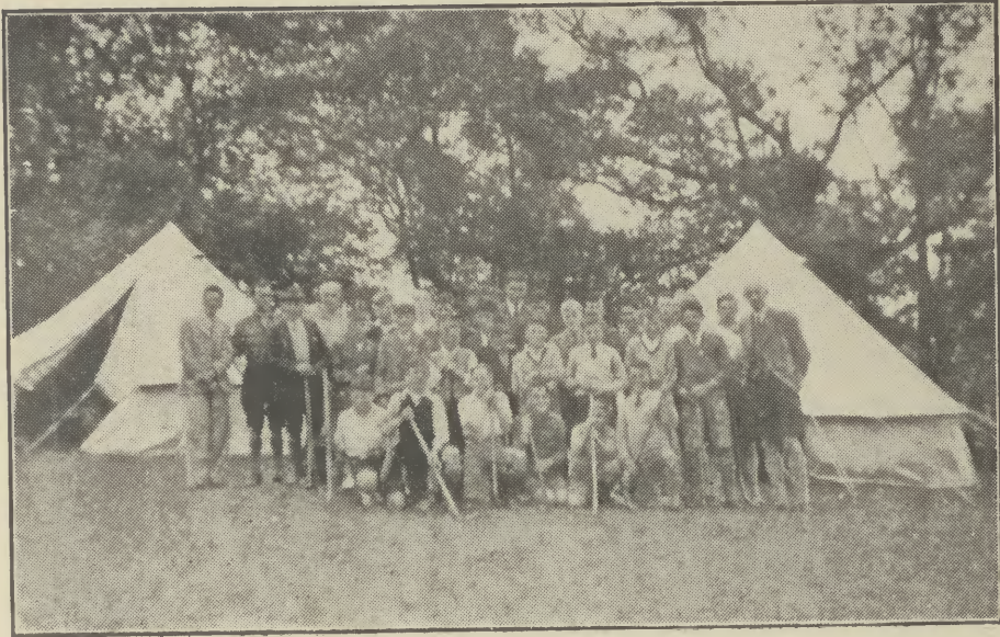
Fo sgàil nan craobh.