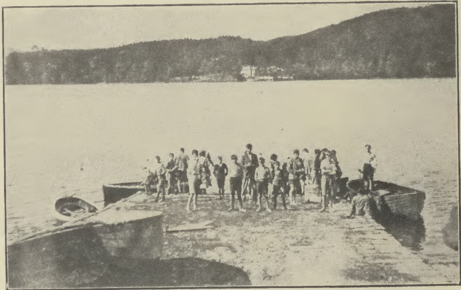
A' falbh gu cuirm-chnic.