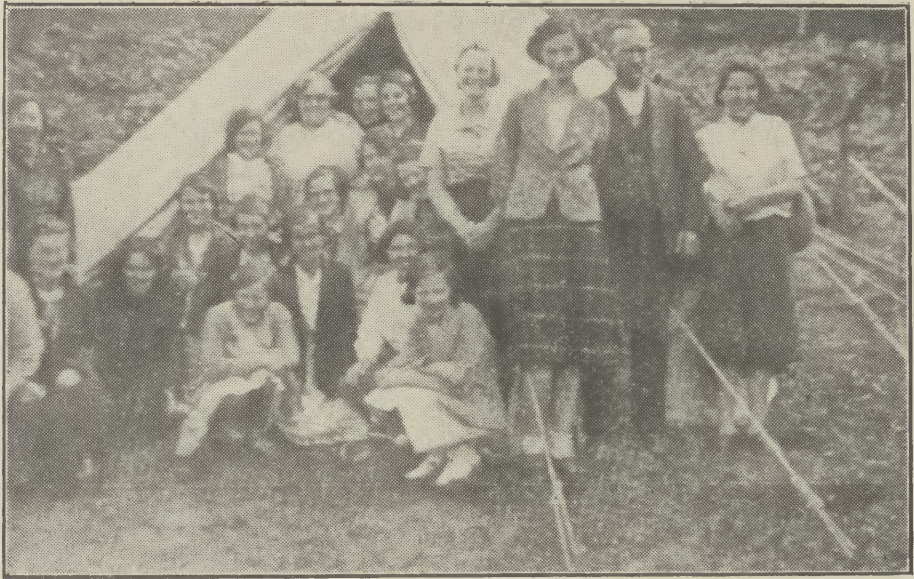
Na Caileagan, 1937.