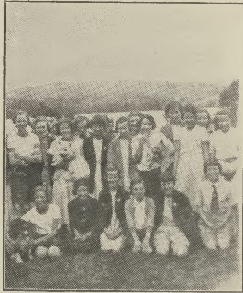
Fa-chomhair Cruachan Beann.