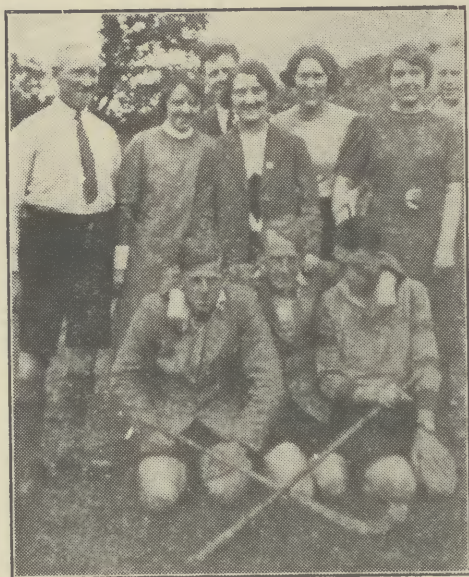
An Luchd-dreuchd, 1937.