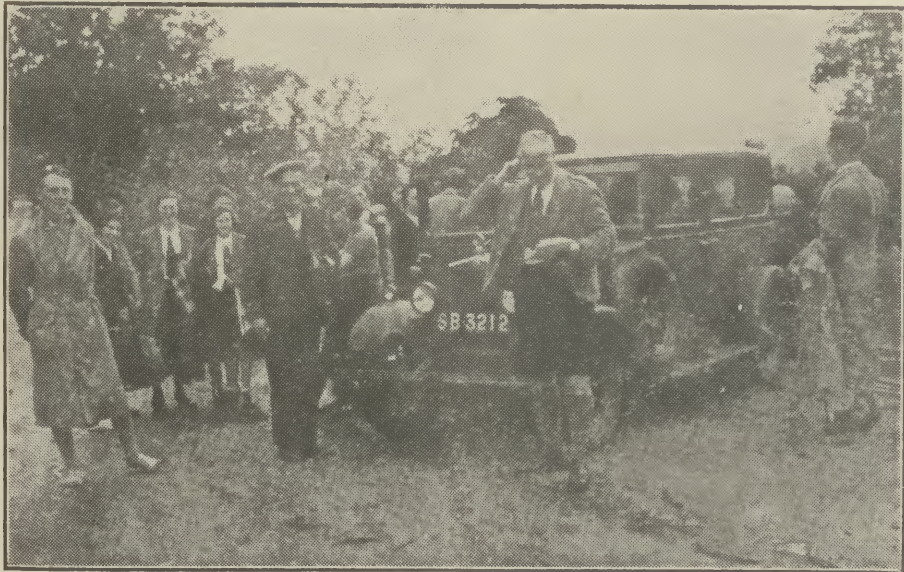
Domhnall a' tachas a chinn mu cheist iomchair.